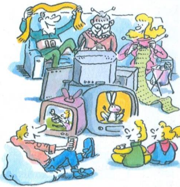
شکل ۳: Alter ego 1 (درس چهارم)

Vous témoignez vous aussi pour le magazine Téléjournal . Vous décrivez vos habitudes : vos différentes activités, vos horaires ; vous précisez quel type d'émission vous regardez à la télévision, et à quel moment de la journée.