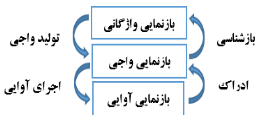
شکل ۱: مسیر فرایند شکل‌گیری دگرگونی آوا؛ برگرفته از هامن (Hamann, 2014)

دگرگونی واجی از دگرگونی آوایی ناشی می‌شود. برای دگرگونی آوایی، بازنمایی واژگانی با تولید واجی در قالب آوا بازنمون می‌گردد. هامن (Hamann, 2014, p. 9) این روند و پیوند را با شکل (۱) نشان داده‌است. پیش‌تر، برمودز-اوت‌هرو (Bermúdez-Otero, 2007; ) این بازنمایی‌ها را به ترتیب از بالا به پایین، رسم کرده و شرح سمت چپ شکل زیر (تولید واجی و اجرای آوایی) را بیان کرده بود، ولی، هامن (Hamann, 2014) فرایند وارونه‌ای که بیان‌گر نقش ادراک شنونده از بازنمایی آوایی و بازشناسی بازنمایی واجی در بازنمایی واژگانی (در سمت راست شکل) است، را در این رویه نشان داده‌است.